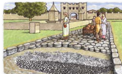
Eerst wordt een rand met stenen gelegd. Daarop komen losse stenen. Dan een laag cement en grote platte stenen.

Een villa is een groot Romeins huis. Er wonen rijke Romeinen. Een villa staat vaak buiten de stad. De vloer of de muur is versierd met mozaïek . Die versiering wordt gemaakt van heel veel kleine stukjes steen in mooie kleuren.