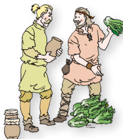
Een Romein ruilt spullen met een Germaan.

Nehalennia is een Germaanse godin. Ze beschermt boeren en mensen op zee. Jupiter is de belangrijkste god van de Romeinen. Eigenlijk is het dezelfde god als de Griekse god Zeus.