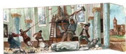
Protestanten vernielen beelden in kerken.

Erasmus wil de kerk hervormen. Hij vindt dat mensen zelf mogen bepalen wat ze willen geloven. Maarten Luther wil de kerk ook hervormen. Hij vindt dat iedereen de Bijbel moet kunnen lezen. Daarom vertaalt hij het boek. Zijn volgelingen heten protestanten. Ze vinden dat er geen beelden van Jezus of Maria in de kerken mogen staan. Daarom vernielen ze deze heiligenbeelden. Dat heet de Beeldenstorm.