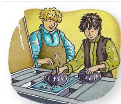
Met inktballen smeert je inkt op de letters.

In deze tijd ontdekken geleerden nog meer. Ze ontdekken dat de aarde om de zon draait. Ze ontdekken ook het kompas. Dat helpt ontdekkingsreizigers zoals Columbus om over zee Amerika te ontdekken.