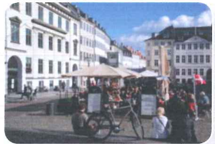
Fijn op een terrasje wat drinken: de welvaart in Scandinavië is hoog.

De mensen in Scandinavië zijn best rijk. De welvaart is er hoog. Ze zijn vaak ook heel gezond. Ook het welzijn is er goed. Estland, Letland en Litouwen noem je de Baltische Staten. Zij waren een onderdeel van de Sovjet-Unie. Sinds 1991 zijn ze onafhankelijk.