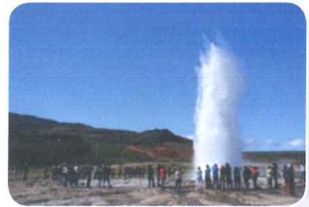
Een geiser spuit water heel hoog de lucht in.

Op IJsland zit de aardwarmte niet zo diep. Het kan makkelijk het grondwater verwarmen. Dat wordt dan een warmwaterbron. Als het water heel hard naar buiten spuit, noem je het een geiser. De kust van Noorwegen bestaat uit kale rotsen met inhammen: fjorden.