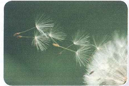
De wind blaast de zaden van de paardenbloem weg.

Make-up gebruik je om jezelf mooier of opvallender te maken. Het wordt gemaakt met kunstmatige kleurstoffen. Pigmenten zijn natuurlijke kleurstoffen. Ze worden bijvoorbeeld gemaakt van zand, steen of luizen. Als je olie bij een pigment doet, kun je je eigen verf maken. Met de kleuren rood, geel en blauw kun je alle andere kleuren maken. Van sommige kleuren word je vrolijk, van andere somber of rustig. Dat heet kleurbeleving. Om anderen te laten zien dat we bij een groep horen, gebruiken we groepskleur. Met kleuren en vormen kun je mensen voor de gek houden. Als een tekening lijkt te bewegen terwijl hij stilstaat, is dat gezichtsbedrog. Ook in straattekeningen gebruiken kunstenaars gezichtsbedrog. Razzle dazzle is gezichtsbedrog dat je gebruikt om juist niet op te vallen, zoals een zebra in een kudde.