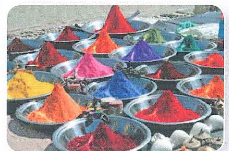
Met pigmenten en wat olie kun je verf maken.